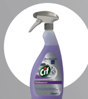
CIF PROFESSIONAL 2IN1 DESINFIZIERENDES REINIGER