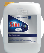
SUN PROFESSIONAL FLÜSSIGER GESCHIRRREINIGER