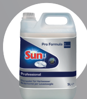
SUN PROFESSIONAL KLARSÜPÜLER SAUER