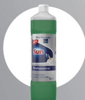
SUN PROFESSIONAL HANDSPÜLMITTEL