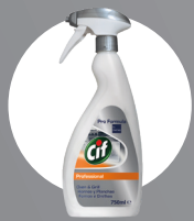
CIF PROFESSIONAL OFEN & GRILL (ÄTZEND)