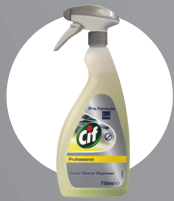
CIF PROFESSIONAL POWER FETTLÖSER