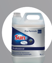
SUN PROFESSIONAL KLARSPÜLER