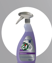
CIF PROFESSIONAL 2IN1 DESINFIZIERENDEINIGER