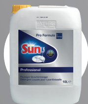
SUN PROFESSIONAL FLÜSSIGER GESCHIRRREINIGER