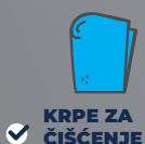
KRPE ZA ČIŠĆENJE