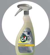
CIF POWER CLEANER DEGREASER