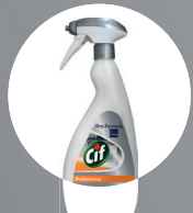
CIF OVEN & GRILL CLEANER (CORROSIVE)