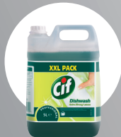
CIF DISHWASH EXTRA STRONG LEMON